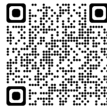
QRコード：青葉小児童の発表の様子