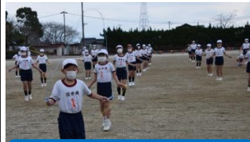
持久跳びにチャレンジ！

新型コロナウイルス感染症対策で、保護者の参観がなくなってしまいましたが、全学年2日間に分けて、なわとび大会を実施しました。それぞれの学年で、趣向を凝らした種目へのチャレンジが設定され、子どもたちはこれまでに練習してきたことを存分に発揮できたようでした。