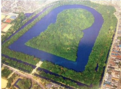
(資料2) 大仙古墳を造るための人数や費用など