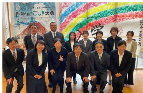
【令和5年度国中転入職員の14人】

国中の教育活動、PTA活動に対する御理解・御協力。そして、御支援を賜りますよう、何卒お願い申し上げます。