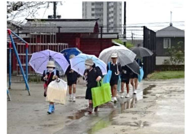
雨の日でもたくましく歩いて登校