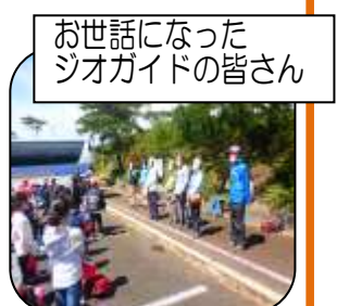
お世話になった ジオガイドの皆さん