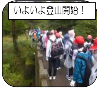
いよいよ登山開始！

1日目は白鳥山登山でした。あいにく霧雨が降る中での登山でしたが、6人のジオガイドさんから霧島の自然についての説明を受けたり、安全な登山の仕方について教えていただいたりしながら、無事に登山を終えることができました。2日目は、センター内でレクリエーションを行って楽しく過ごしました。5年生の子供たちにとって思い出に残る1泊2日の宿泊学習となりました。