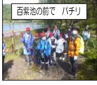
百紫池の前で パチリ