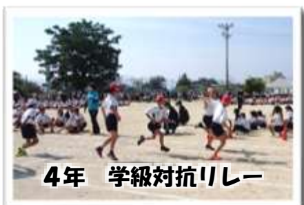
4年 学級対抗リレー