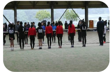
【 女子ソフトテニス 】