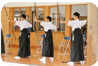
【 弓道(男子) 】