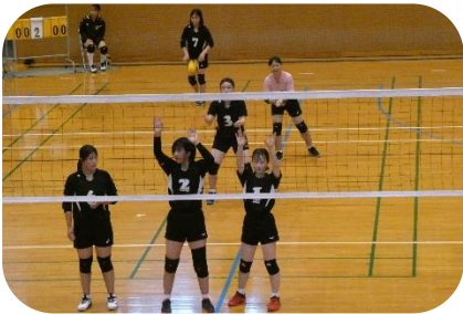
【 女子バレー 】