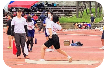
【 陸上(砲丸投げ) 】

また、惜しくもこの大会を最後に、部活動を引退することになった3年生のみなさんは、部活動を通して多くのことを学んだことと思います。幾つか挙げてみると、技術面、チームワークや礼儀作法、準備の大切さなど多岐に渡ります。これらのことに取り組んだり、感じたりする経験をもてたことは、一人一人にとってかけがえのない宝物となったことでしょう。それをこれからの学校生活に生かすとともに、目前にある自分の進路決定に臨んでいってください。ここからRe:スタートです。