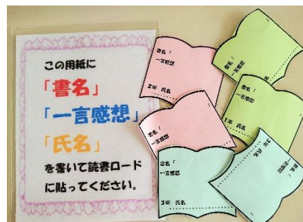
【 皆で446冊を目指そう 】

6月15日時点の読破数は250冊を超えました。目指すゴールに近づくためには、日々の一冊一冊の積み重ねが大切です。興味があるジャンルやオススメの本、友達のカードに書かれた本の題名や感想を参考になど、学校のみならず家庭でも読書に親しんでほしいと思います。