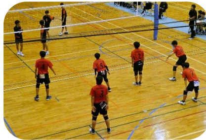
【 男子バレー伊佐マジエスティ 】