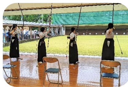
【 弓道(女子) 】