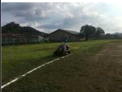
事前に芝刈りをしてくださいました