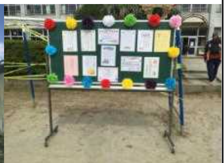
祝詞をたくさんいただきました