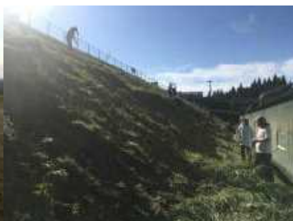
直前の愛校作業ありがとうございました