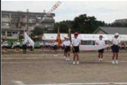
整然とした入場行進

コロナ禍だからこそ、一つ一つの行事の意義を再度考え直し、子供たちの活躍の場をできる限り確保することを最優先にして、本年度の運動会を組み立てました。子供たちの頑張りに、私たち大人が、地域が、元気をもらいました。ありがとう。