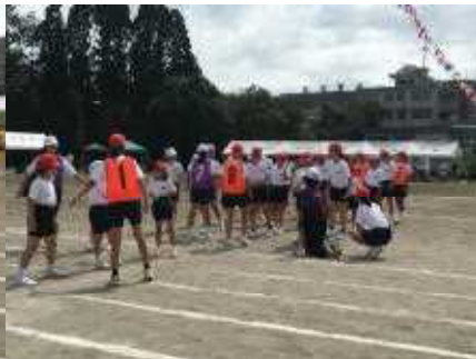
学年の代表 縦リレー