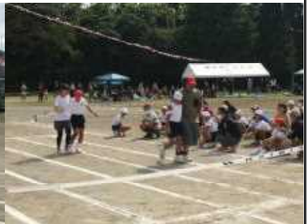
6年親子 良い思い出になりました