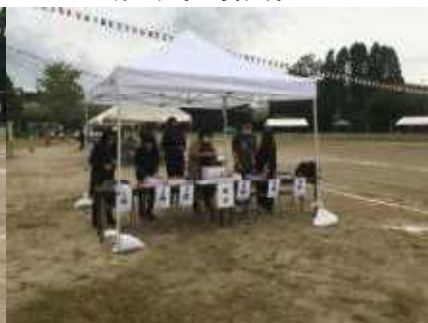
コロナ対策 受付への御協力に感謝