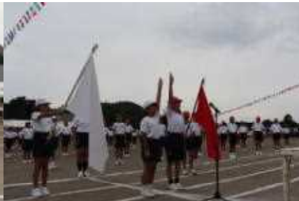
選手宣誓 堂々とした姿