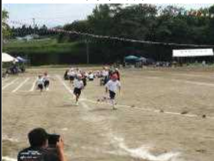
一生懸命走りました