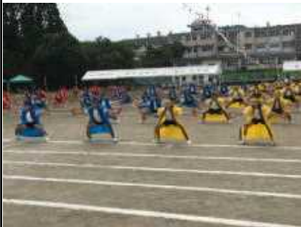
さすが上学年 かわいいソーラン