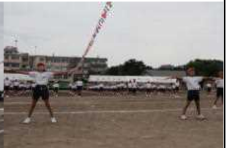
盛り上げてくれた両応援団