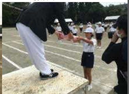
悔しくても立派な態度