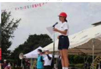
系の仕事も責任持って