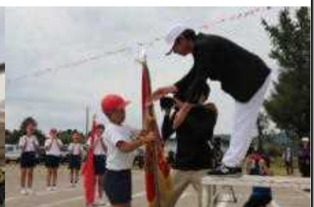
優勝紅組おめでとう！