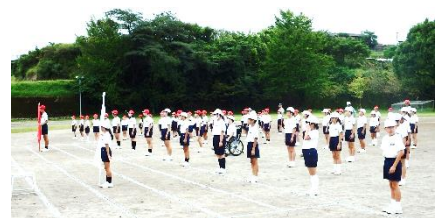
【運動会全体練習の様子】

運動会当日も108人全員が、持てる力を発揮し、見ている保護者や地域の皆様方に【感動】を届けられるよう最後まで諦めずに全力を尽くしますので、多くの保護者の皆様・地域の皆様のご参観をお待ち申し上げます。