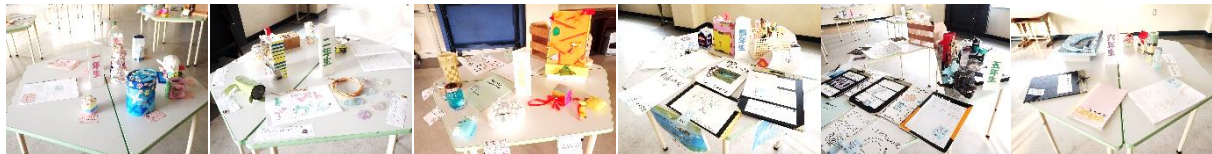
【学年ごとに展示された「校内夏休み作品展」の作品】

他にも、市で入選に選ばれたり、作品作りに取り組んだり、多くの子供たちが頑張りました。