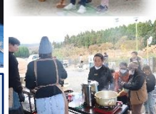
12/13 CS (コミュニティスクール) の日