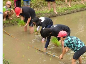
田植えの様子 (1～6年生)