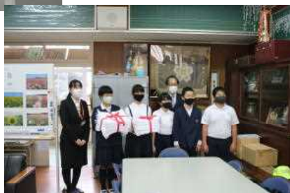
【始良伊佐法人会 女性部会の皆様から いただいた雑巾】