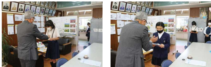
【始良伊佐法人会事務局長さんから表彰】