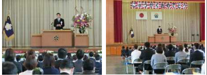
入学式の様子から