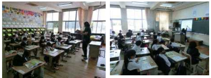
1年生もいよいよ学習が始まりました！