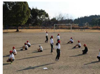
【体育の授業での練習】