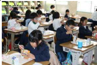
【救給カレーを食べる子どもたち】

1月13日(水)の給食は、救給カレーと牛乳でした。1月12日に溝辺学校給食センターの蒸気ボイラーが故障したためでした。災害などで給食が作れないときのために、本年度から各学校に備蓄されていました。高学年にとっては量が少なかったかとは思いますが、子どもたちは「思っていたよりおいしい」と言いながら食べていました。