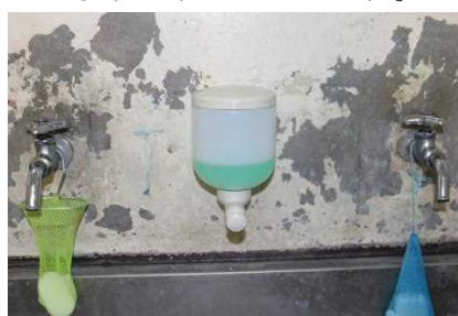
【すぐ使えるように液体石けんへ】