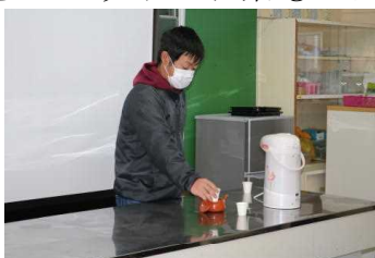
【お茶の入れ方の実演】

当日は、始良・伊佐地区茶業青年の会から溝辺地区でお茶を生産されている4名の方が講師として来てくださいました。「お茶を知って、おいしく飲もう！」というテーマのもと、①お茶ってなに？、②お茶はどこで作られているの？、③お茶ってこんなにすごいぞ！、④みんなでお茶をいれてみよう！とクイズ形式でお茶のことを学びました。最後は、おいしいお茶の入れ方を教えていただき、実際に自分たちでお茶を入れて飲みました。「すごくあまい」などと感想を発表していました。また、急須やお茶の飲みくらべセットのお茶もいただきました。