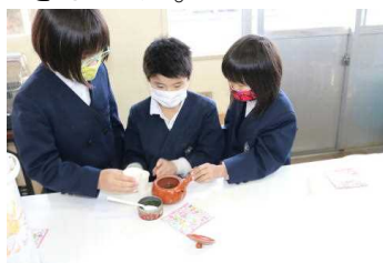
【実際に入れてみる】