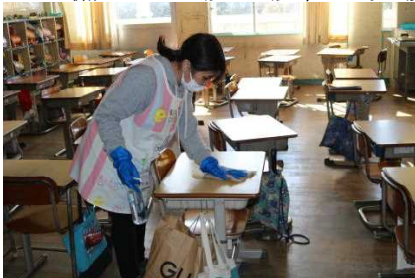
【スクール・サポート・スタッフによる机の消毒】

また、学校でも、子どもたちがよく触る場所などの消毒や、新型コロナウイルス感染防止対策となる備品・施設の設置・交換などにも取り組んでいます。