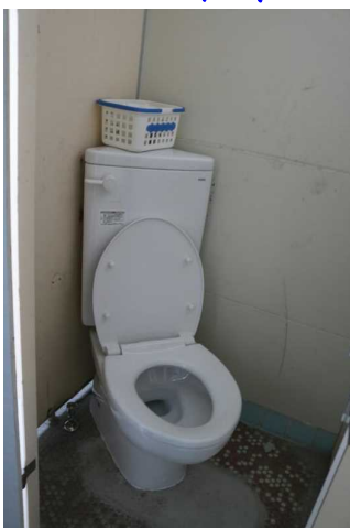
【設置されたトイレ】

この夏休みに、トイレの洋式化の工事がありました。全部で11か所が洋式トイレとなりました。これまでは、体育館2か所と教室棟1階に1か所ずつでしたが、教室棟2・3階、特別教室棟1・2階とすべてのトイレに洋式トイレが設置されたこととなります。子どもたちも安心して使っています。きれいに使ってほしいです。