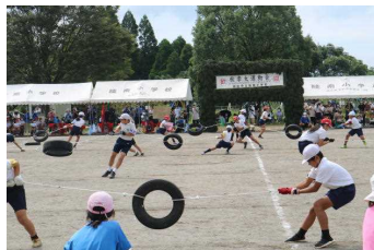
【5年 タイヤとり合戦】