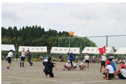
【6年 ソーシャルディスタンス玉入れ】