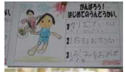
【1年生の運動会のめあて】

また、子どもたちには、「陵南あそはな」にしっかりと取り組もうと呼びかけました。特に、「そ・は」をこの2学期みんなですっきりできるようになろうと呼びかけてあります。掃除は隅々まで時間いっぱい取り組んだり、はきものをしっかりとそろえたりできる陵南小学校の子どもになるように指導していきます。