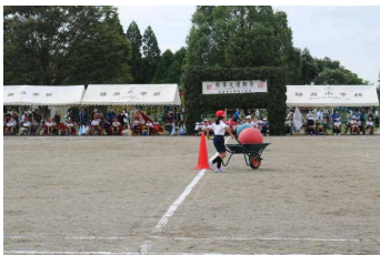
【2年 ゆっくりいそげ】