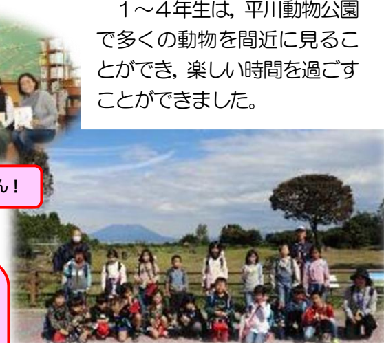
◇ キリンと桜島をバックにパチリ！（1~4年生）

1~4年生は、平川動物公園で多くの動物を間近に見ることができ、楽しい時間を過ごすことができました。