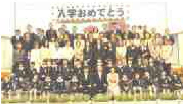
3組 男子12名 女子12名 計24名