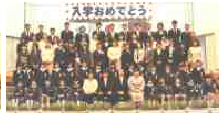
4組 男子12名 女子12名 計24名