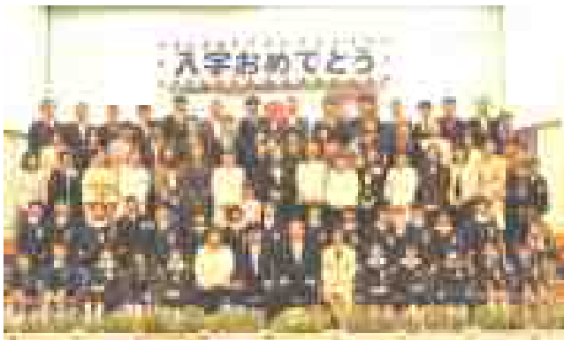
1組 男子12名 女子12名 計24名