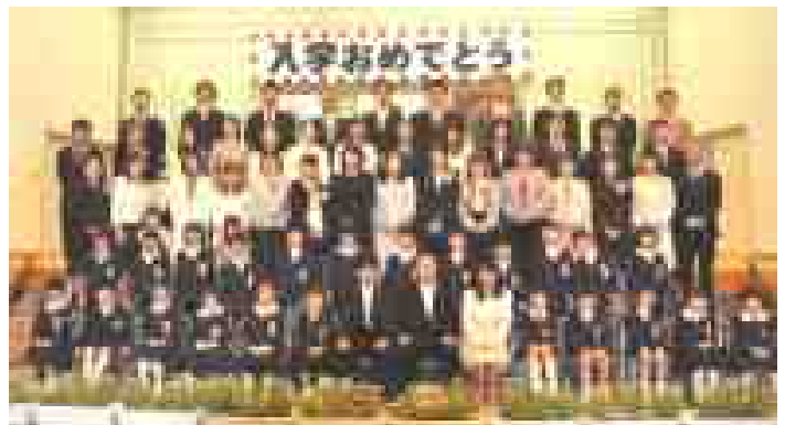
2組 男子12名 女子12名 計24名