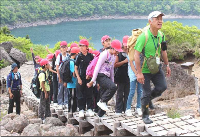
ジオガイドの方を先頭に登る子供たち