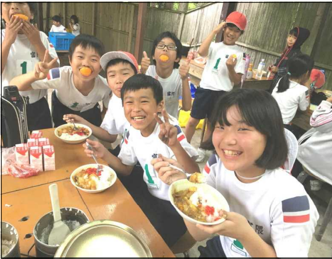
協力して作ったカレーは最高！