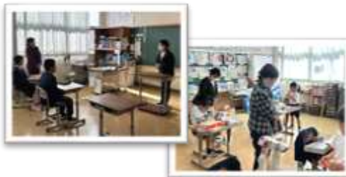
【2月】第2回学校評議員会

2学期も、全体的に概ね良い評価でした。1学期に課題としていた自己肯定感については、子どもたちの自己評価が上がってきています。今後も、子どもたち一人ひとりの頑張りを認め、居場所づくりを大切にしていきたいです。家庭や地域でも、励ましの声掛けをよろしくをお願いします。