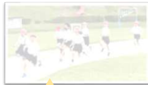
元気に朝の体力づくり

保護者や地域の方々におかれましては、本校の教育活動にご理解をいただき、子どもたちを見守り、励ましの言葉をかけていただけたらと思います。今年度もどうぞよろしくお願いいたします。