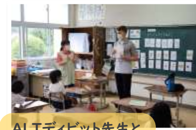
ALTディビット先生と