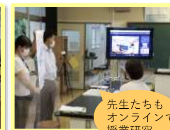
先生たちもオンラインで授業研究

3・4年生は、佐々木小の3年生（1名）と外国語の学習をしています。安良小から転校した友だちということもあって、お互いうれしそうです。