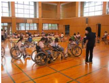
【4年生：福祉体験学習】

新型コロナウイルスの影響でこれまで実施できなかった学習も感染状況を確認しながら徐々に再開してきています。