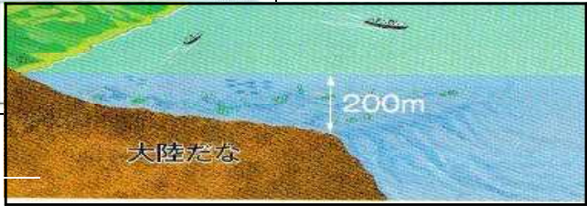
[2013年 水産庁調べほか]