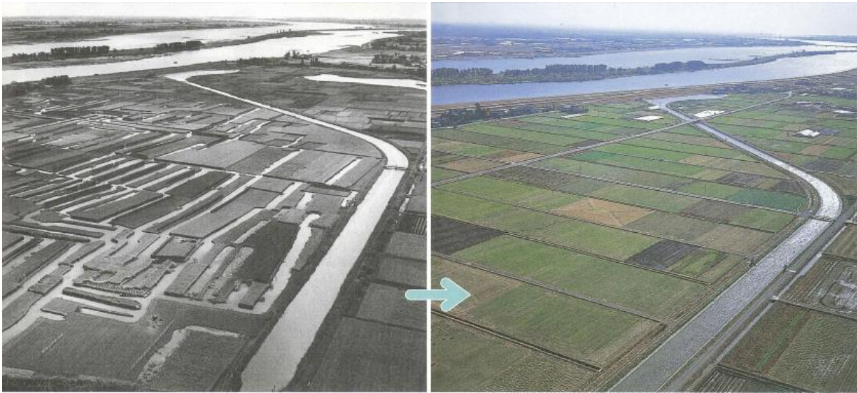
うめ立て前の水田の様子（1968年）