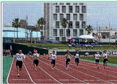
8レーン(左端)が1くん、タイムレース決勝の走り(白波スタジアム)

を体力秒走でてなジまな 期で強9!、改つアさつ雨 待のい9運1装たムかた天 ささ走は動・さ。の陸の せるらり立靴れ国で「上た る、。の君競へ開波技順 活県そ1が技向催スは延 躍総の2快場けとタ、と