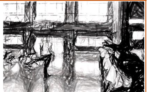
校長先生、激励のことば

一つ目は、できていること、できていないことなどいろいろなことを考えながら新しいことに挑戦してください。二つ目は、今、活動できていることが当たり前と思わずに、周りで支えてくださる方々に常に感謝の気持ちをもって大会に参加してください。