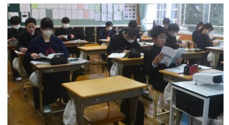
授業の様子(2年生社会)